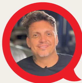
TARSO MARQUES EX PILOTO F1 LATA VELHA E AUTO ESPORTE