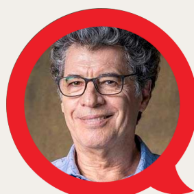
PAULO BETTI ATOR DRAMATURGIA