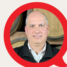
LUCIANO LOPRETO VINÍCOLA GOES