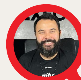
YURI FLY GAMERS CLUB